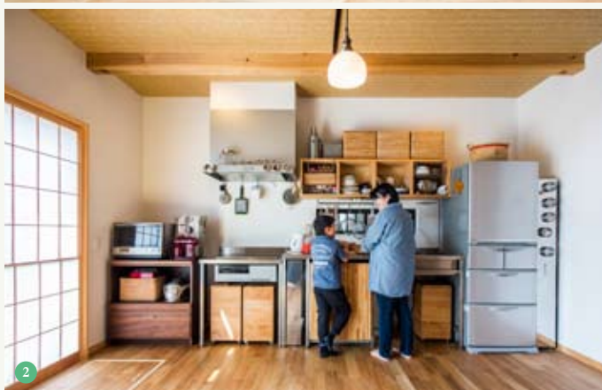
① LDK 内に階段を設け、吹き抜けで2階ともつながる、家族のコミュニケーションを大切にしたプラン。昔の日本の照明器具が味わい深い ② ステンレスでオーダーメイドしたキッチン、扉がないから湿気がこもらず清潔。食洗機の前面には木を張った