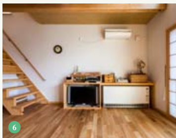
⑤ 「高齢になったら1階で生活できるように」LDK に小上がりの和室を併設。ゴロゴロくつろげ、腰掛けられ、下を収納に活用できる ⑥ シンプルな木のテレビボードを造作し、カウンターの下には蓄熱暖房機を設置。吹き抜け空間を穏やかに暖める