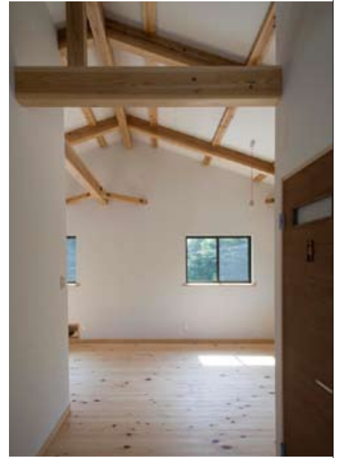
2階は将来の家族構成の変化にも対応できるように、がらんとした空間に。床は檜の無垢フローリング、壁は自然素材壁紙

4.「布団派」なので寝室は縁なし畳の和室に。調湿性の高い塗り壁が安眠を誘う。勾配天井がゆったりした広がり感を演出 5.2階ホールを1段高くしたフリースペース。カウンターに向かって腰掛け、窓からの景色を楽しめる。右手寝室との壁には小窓を設けた